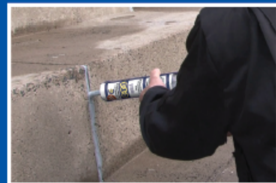
Hurtigt og yderst stærkt universaltætnings- og klæbemiddel til bygningshåndværk og reparation