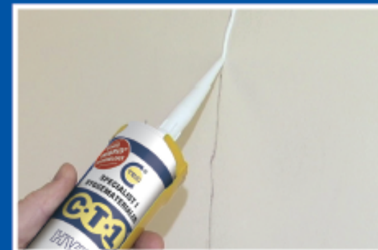
Perfekt til reparation af sætningskader