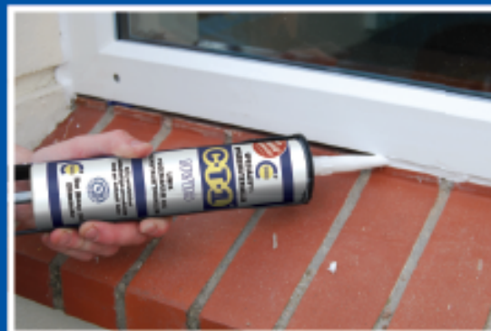
Hurtig tætning af fuger