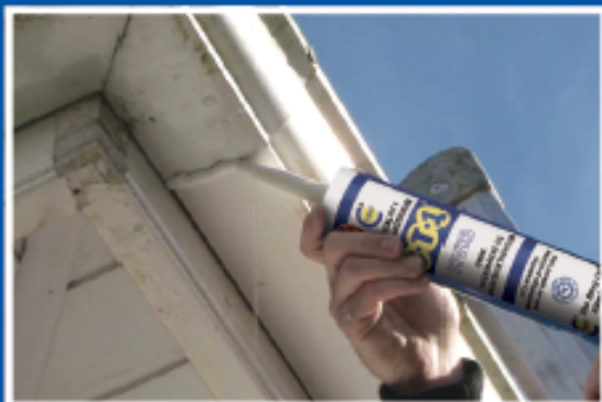
Hurtig reparation af lækkende afløb