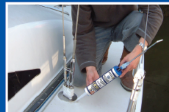
Reparationer på både og skibe